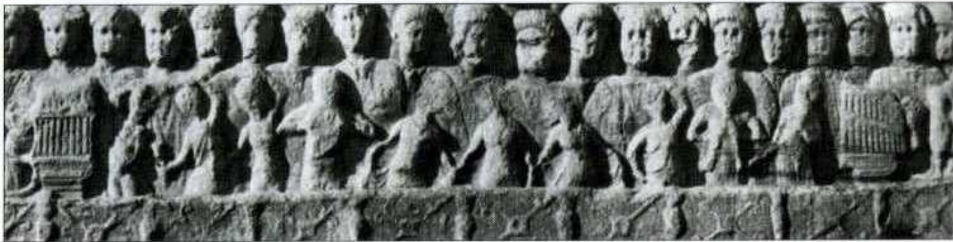
Εικ. 193: Ανάγλυφη βάση του Οβελίσκου του Θεοδοσίου, Κωνσταντινούπολη (περί το 390).

Στον οβελίσκο του Θεοδοσίου εικονίζονται ήδη από τον 4 ο αι. δύο αυτοκρατορικά Όργανα, οι διάδοχοι των ελληνιστικών και ρωμαϊκών υδραύλεων, ενώ ένας πανδουριστής υπάρχει από τον 6 ο αι. στα ψηφιδωτά του Μεγάλου Παλατίου.