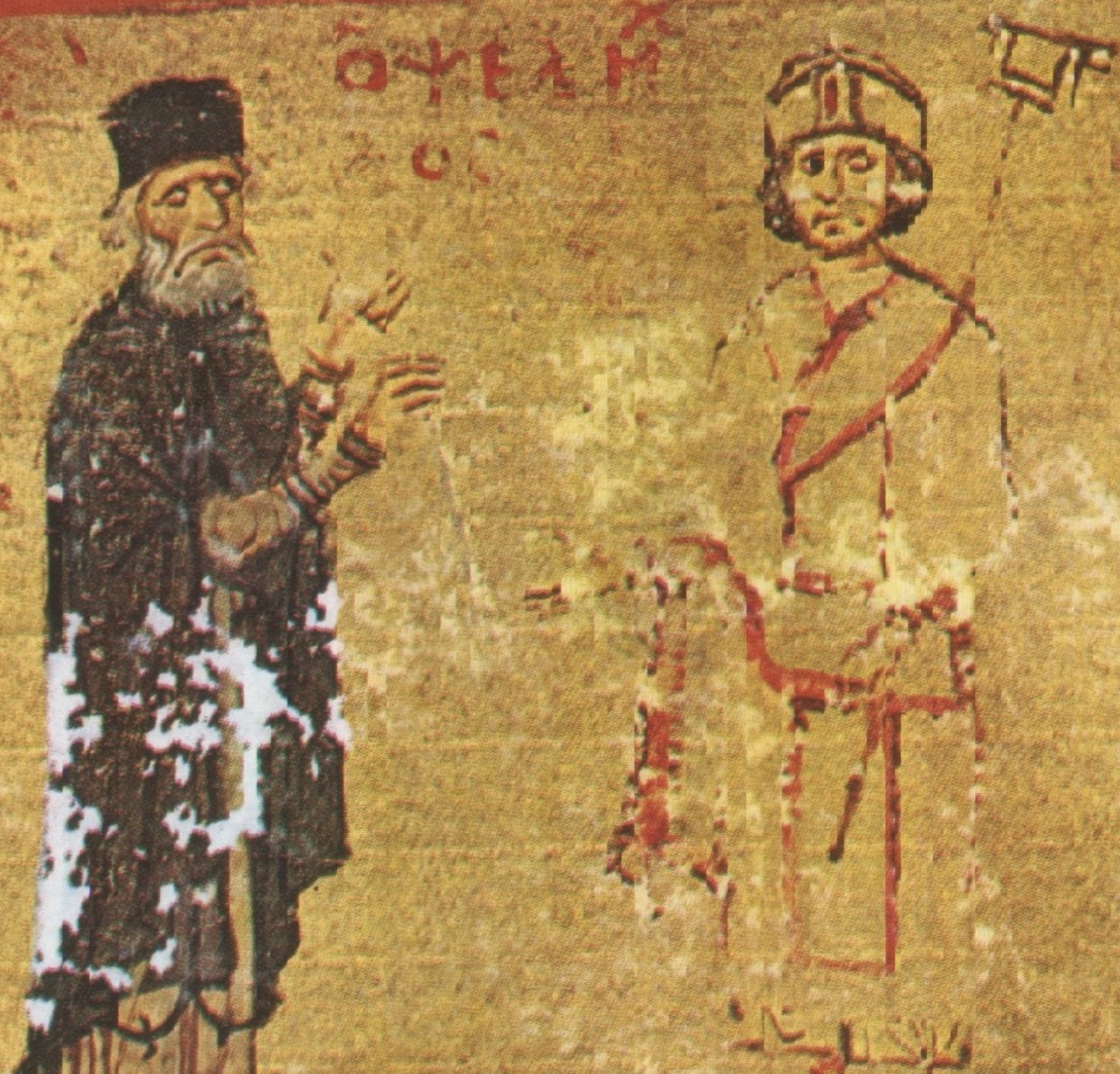
Ο Μιχαήλ Ψελλός (1018 - 1078) και ο μαθητής του αυτοκράτωρ Μιχαήλ Ζ΄ Δούκας