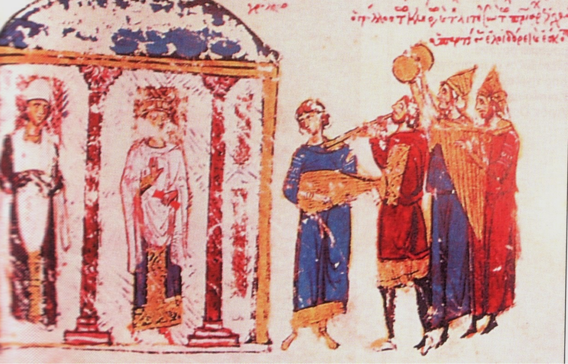
Η λοιδορία του Πατριάρχη Ιγνατίου υπό του Γρύλλου. Μαδρίτη, Εθνική Βιβλιοθήκη, The Greek codex vitr. 26-2, φ. f. 78v. (13' αι., χειρόγραφο Σκυλίτζη).